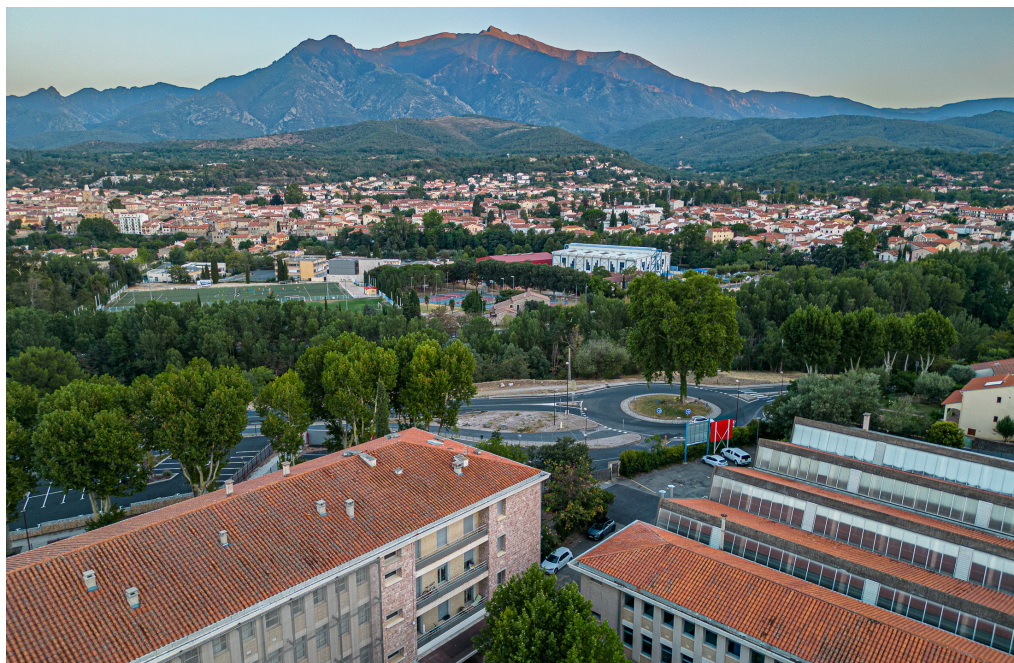
El campus de l'UCE a primer terme, Prada i, al fons, el Canigó