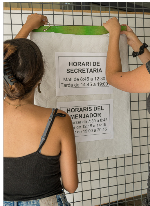
Ultimant tots els detalls abans que arribin els alumnes

Feu servir el hashtag #ucestiu23 Podeu seguir-nos a: Z (antic twitter): @uce_cat — Instagram: uce_cat — Facebook: Universitat