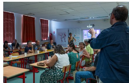
37a Jornada Andorrana de l'UCE