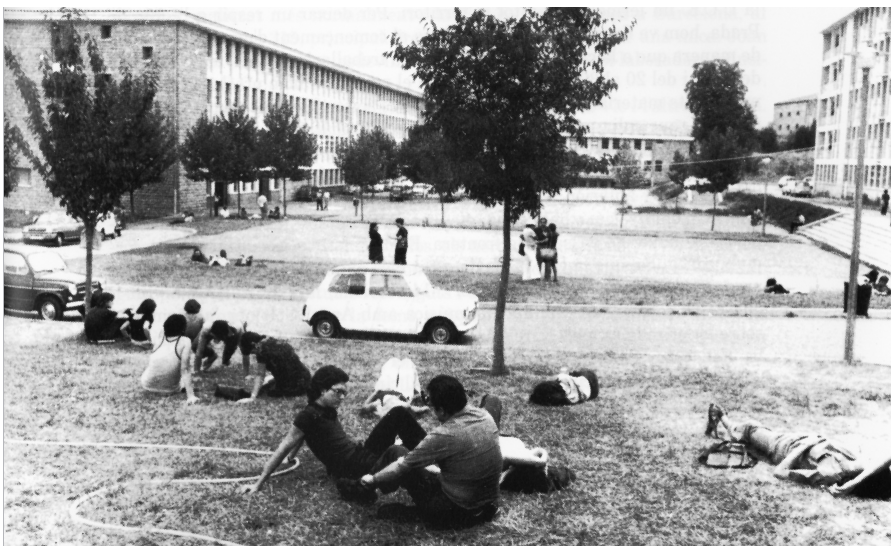
El campus de l'UCE, el 1976

El Campus de l'UCE ha canviat d'aspecte al llarg dels anys