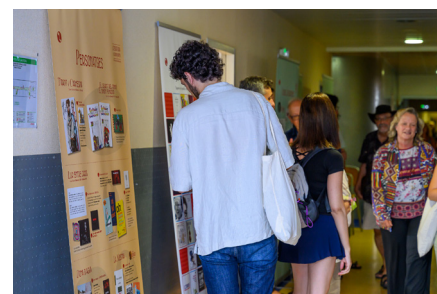
Exposició Literatura i cançons

La celebració de la Universitat Catalana d'Estiu a Prada converteix la capital del Conflent en un pol d'atracció de diverses iniciatives. Així, algunes entitats organitzen jornades per debatre qüestions relacionades amb el seu àmbit de relació, sigui temàtic o territorial. La més antiga és la Jornada d'Agricultura a Prada, organitzada per la Institució Catalana d'Estudis Agraris, enguany sota el títol Viticultura d'alçada i canvi climàtic als Països Catalans . Hi participaran representants i coneixedors de les DO de diferents zones dels Països Catalans per a conèixer la situació actual de la vitivinicultura, els reptes als quals s'enfronta i les seves estratègies de futur. Les sessions tindran lloc avui i demà al matí.