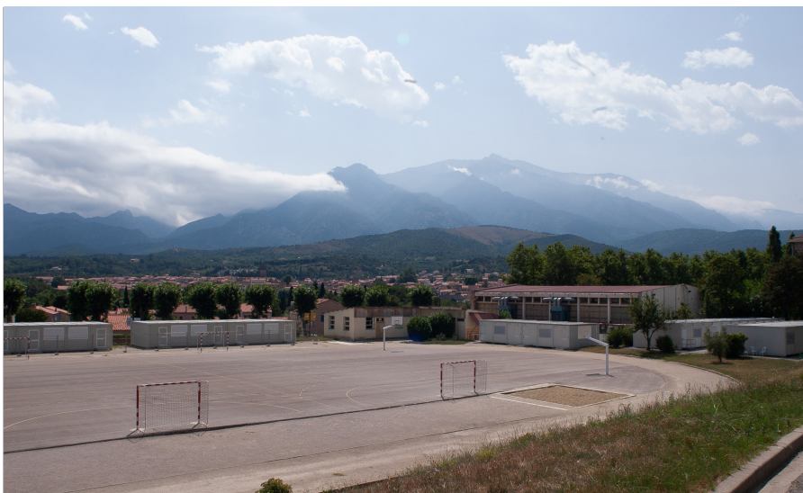
El campus de l'UCE, el 2004, amb el Canigó al fons

El Campus de l'UCE ha canviat d'aspecte al llarg dels anys