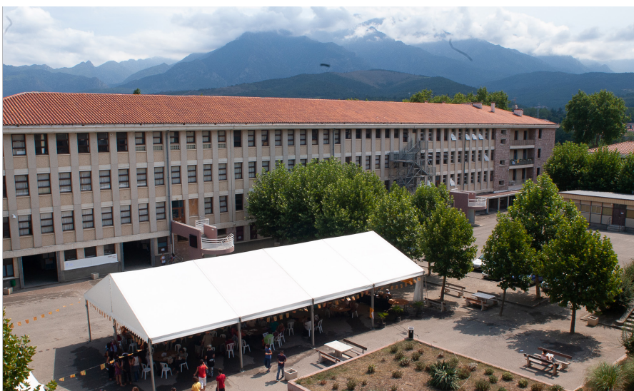
El campus de l'UCE, el 2005

El Campus de l'UCE ha canviat d'aspecte al llarg dels anys