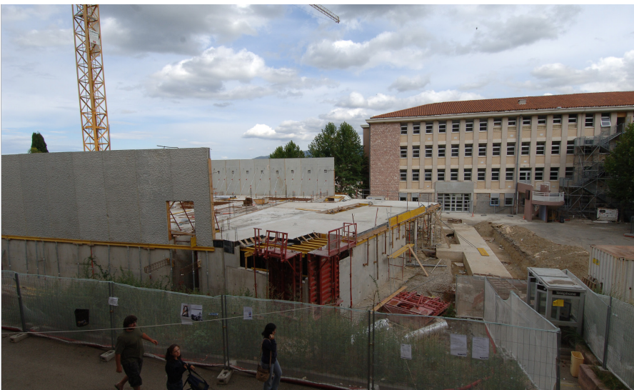
El campus de l'UCE, el 2007, durant la construcció de l'edifici de la biblioteca.

El Campus de l'UCE ha canviat d'aspecte al llarg dels anys