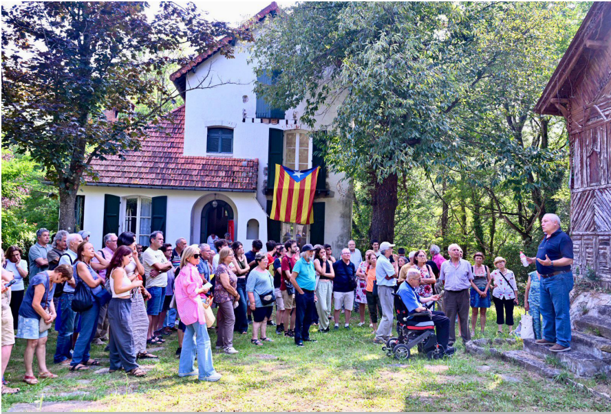
L'acte central de la tarda de dimarts 20 d'agost va tenir lloc a Prats de Molló. Una bona part dels participants de l'UCE es van traslladar a aquesta ciutat del Vallespir on fa prop de cent anys Francesc Macià va liderar un intent per aconseguir la independència de Catalunya. Un dels actes era, precisament, la visita a la casa Macià.