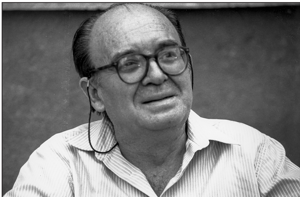
Estellés a la Universitat Catalana d'Estiu el 1990

«Els homes primitius, tot i usant armes tosques, eren molt menys salvatges que no ho són les actuals generacions» Joan Salvat-Papasseit