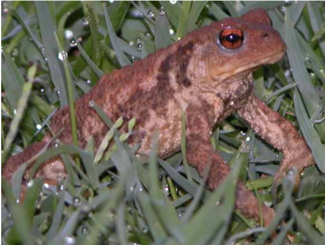
Gripau (Bufo bufo)