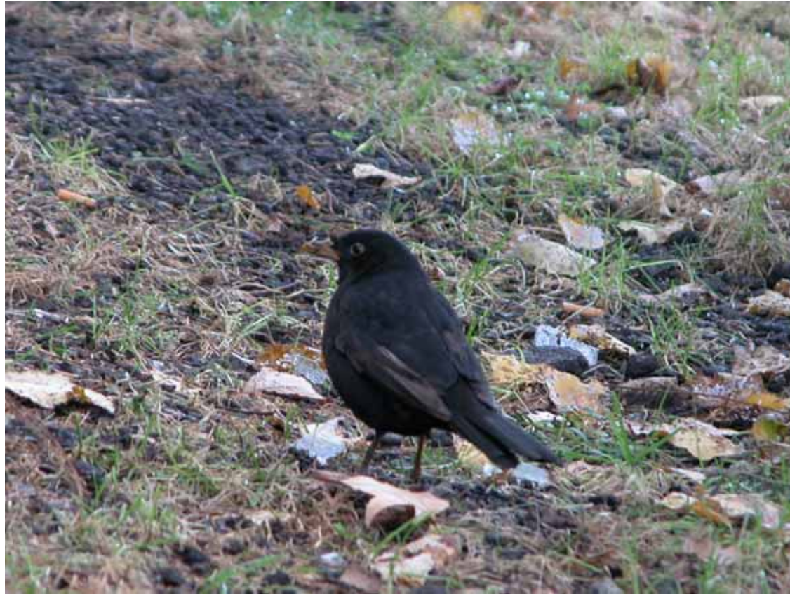
Merla ( Turdus merula )