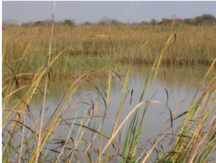
Aiguamoll. Sèquia Major Vilaseca