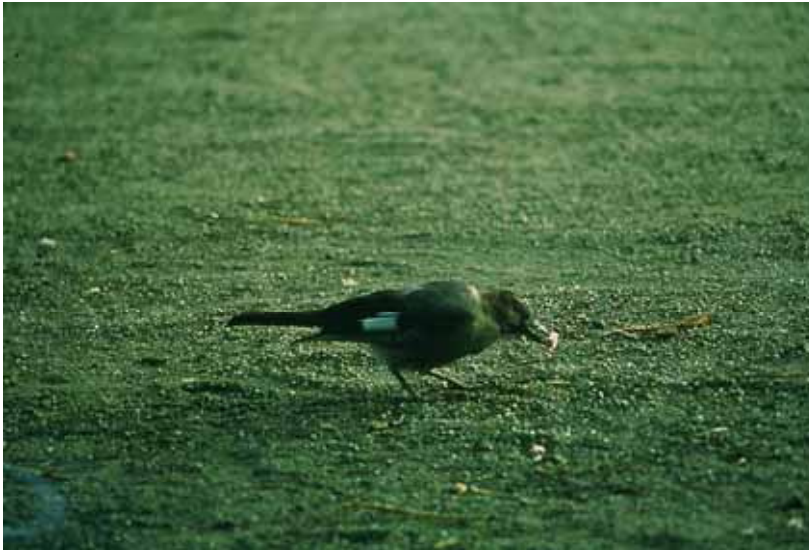
GAIG ( Garrulus glandarius )