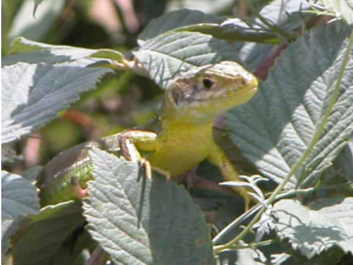
Llangardaix verd ( Lacerta viridis )