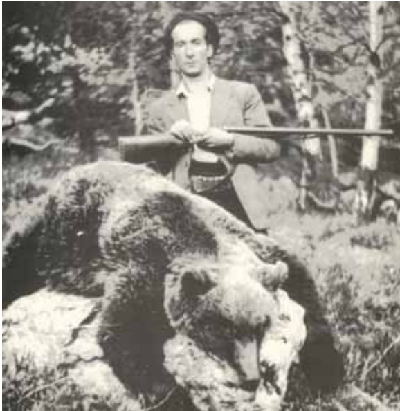
Os bru ( Ursus arctos )