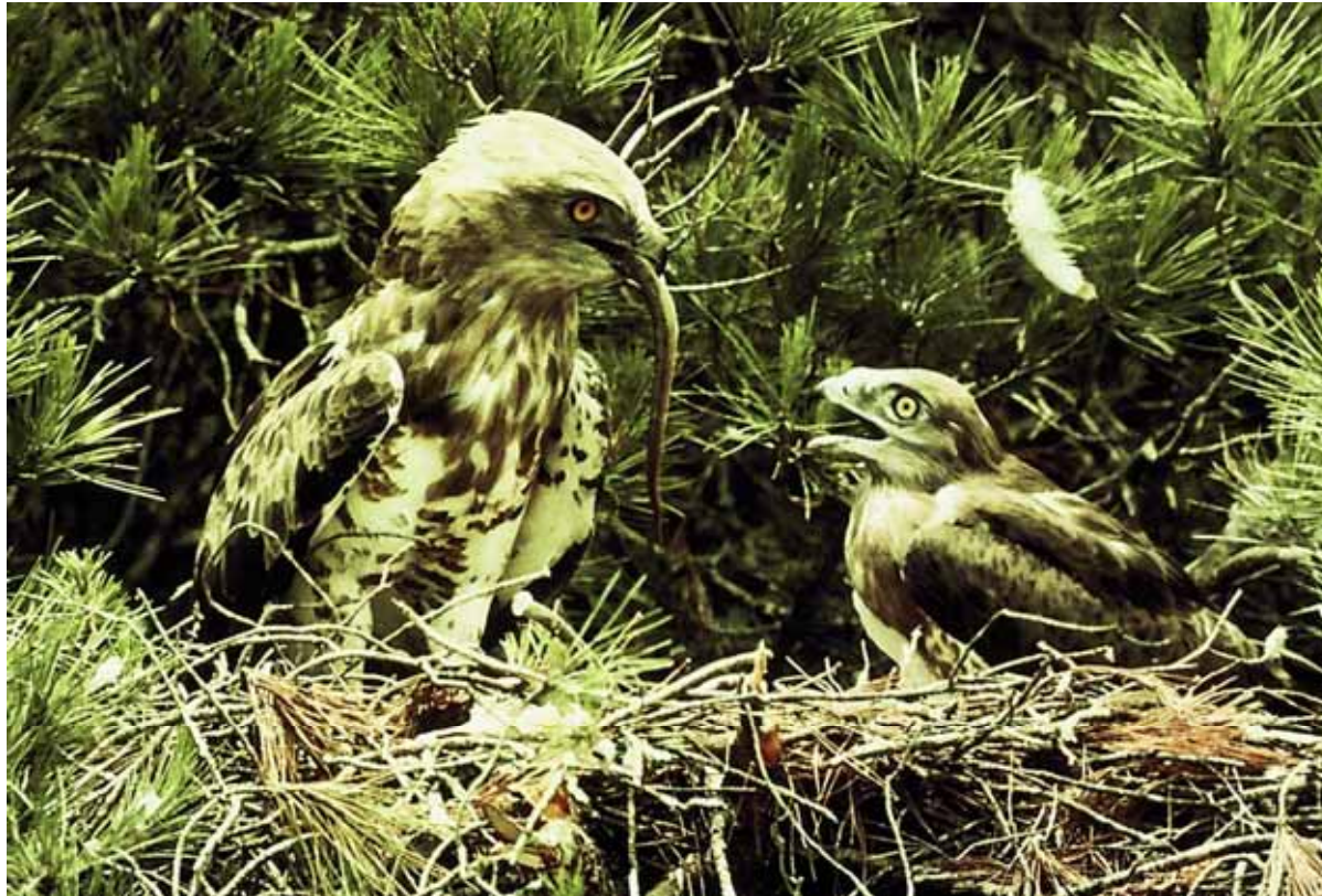
Aguila marcenca ( Circaetus gallicus )