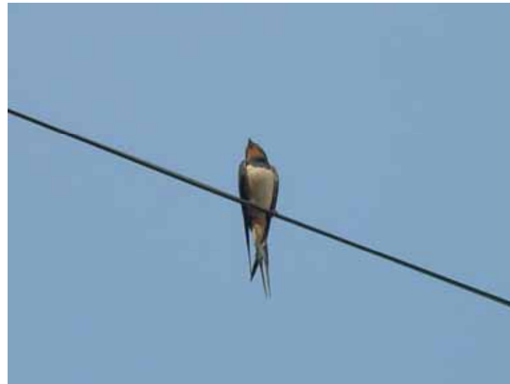
Oreneta ( Hirundo rustica )