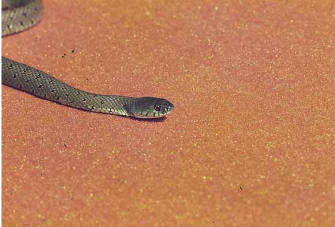
Serp verda ( Malpolon monspessulanus )