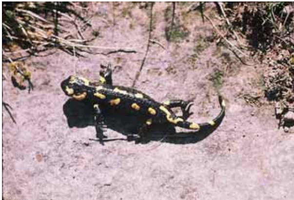
Salamandra ( Salamandra salamandra )