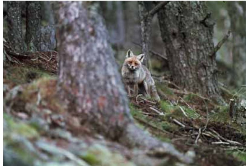
Guineu ( Vulpes vulpes )