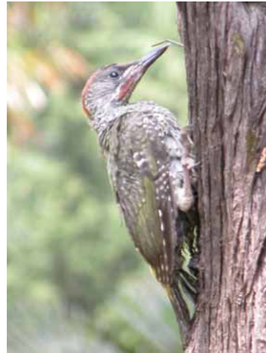
Picot verd ( Picus viridis )