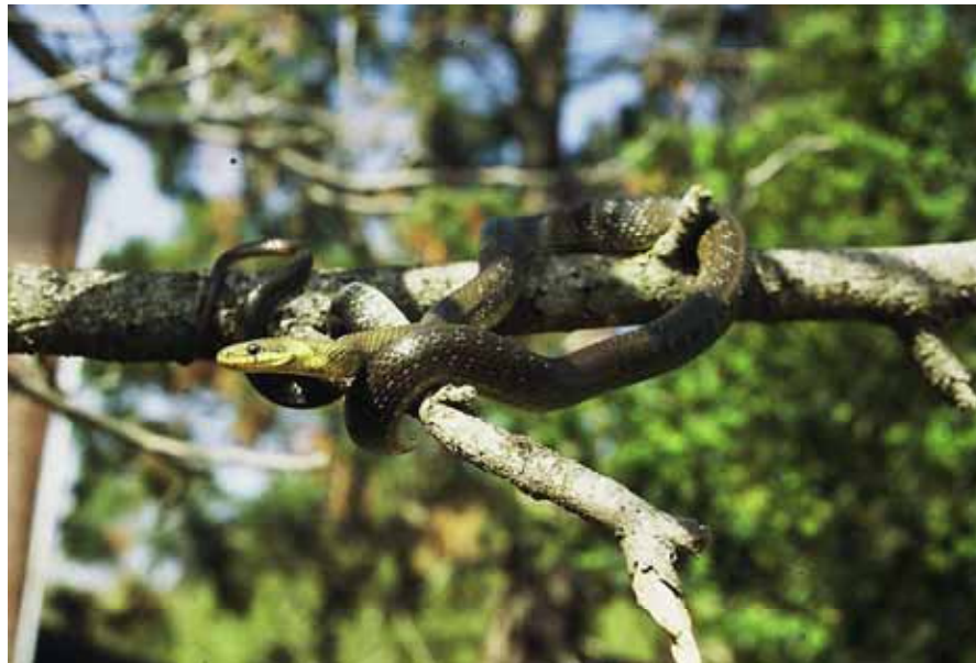
Serp d'esculapi ( Elaphe longuissima )

Pensament Hipocràtic. Hipòcrates de Cos (2.500 BP)