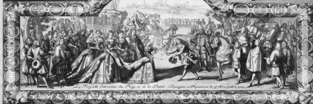
Le Roy et la Reine d'Espagne à Saragosse le 27 Novembre 1701.