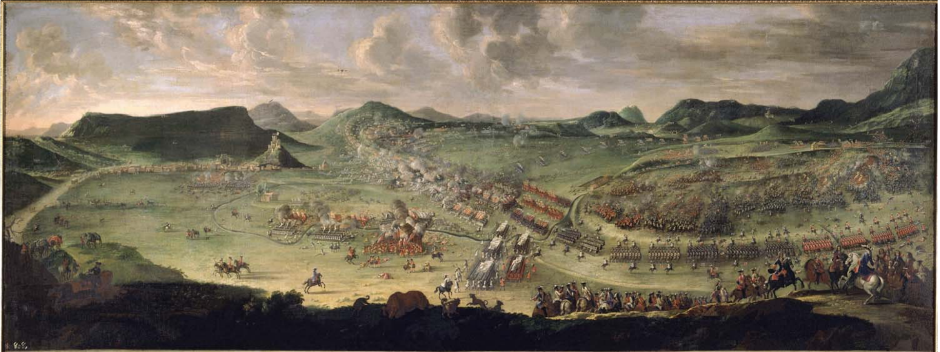
BATAJA A QUE SE DIO EN LOS CAMPOS DE ALMANSA POR LAS ARMAS DE LAS DOS CORONAS, CONTRA LAS DE LOS PORTUGUESES INGLESES Y OLANDESES EL DIA 25 DE ABRIL DE 1707