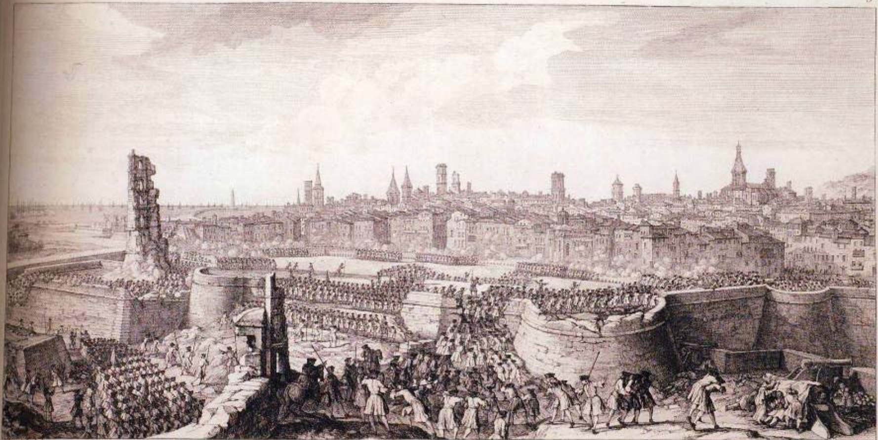
L'assaut donne au Corps de la Place.

Les Bastions étant pris, le d'appui pour être au pied du mur, qui ferme la gorge des bastions, les breches faites à Coup de Canon, ou brèches minees tant Chacques, on fait sommer les assiégés de rendre la place, et au cas de refus on fait mine de l'achèvement, on attaque en même temps la Courtine, et on pousse les ennemis jusqu'au grand retranchement qui Courant le dedans de la Place, on l'attaque en plusieurs endroits tout à la fois, et on fait effort pour assiéger les remparts, on fait rompre à mesure qu'elles avancent on s'efforce qu'il y ait toujours des bataillons qui occupent les breches les fossés, et le logement du chemin couvert, et lorsque l'on ne peut forcer le grand retranchement, on se loge sur les remparts ou du moins sur les breches.